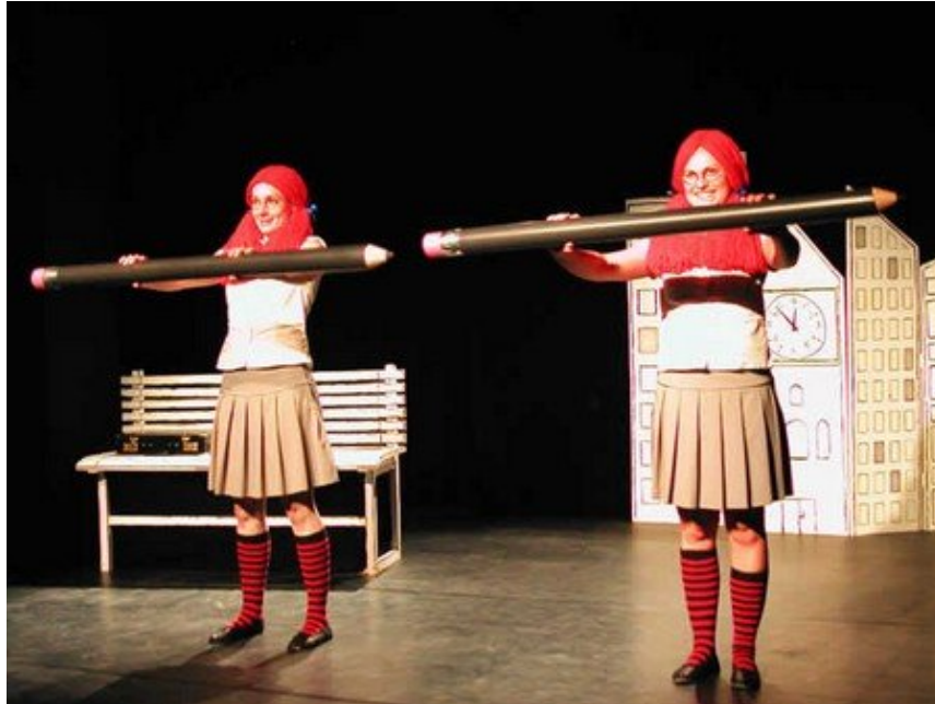
As gêmeas

A trilha sonora começa; uma charanga bem agitada. As gêmeas iniciam uma sequência de movimentos coreográficos, girando os lápis como se fossem batutas. De repente, elas geram duas facas de cozinha por baixo das saias, utilizando-as para afiar os lápis em unicidade, espelhando-se.