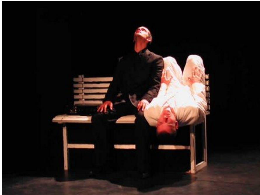
O empresário e o homem de branco

O homem de branco volta ao banco e senta nele de cabeça para baixo enquanto o empresário senta ao lado normalmente, formando um par invertido. Depois de uma pausa prolongada, os dois se levantam e ficam de pé, um na frente do outro, como se estivessem diante de um espelho. Eles se aproximam e o empresário lenta e carinhosamente abraça seu parceiro loiro, enquanto a sinfonia de Gorecki começa a tocar. O homem de branco pega o empresário e carrega-o nos braços como a um neném, ou um amante. Em câmera lenta, ele deixa que o empresário caia de volta ao chão.